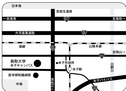
米子キャンパス (医学部試験会場)